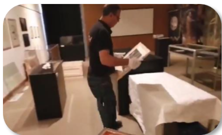
Fin de l'exposition "Pace Eterna, Tombes et outre-tombe" - Musée de l'Alta Rocca (Levie) en Corse.

Le métier passionnant et exigeant de ces spécialistes de l'envers du décor ne peut qu'être riche de belles réalisations et anecdotes !