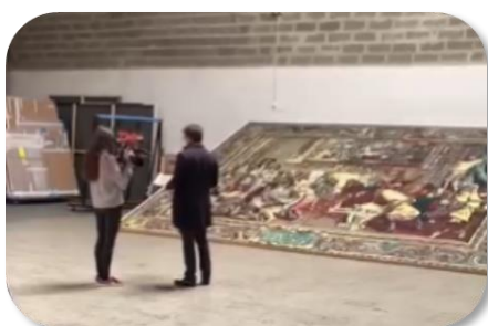
Tournage du groupe M6 pour Epicure Studio. Devant la tapisserie de Charles Le Brun de 1734 reproduite en Lego.