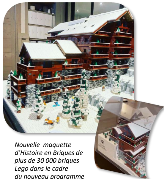
Nouvelle maquette d'Histoire en Briques de plus de 30 000 briques Lego dans le cadre du nouveau programme de résidence FLEUR DES ALPES, de l'acteur immobilier BARNES.