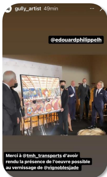
Merci à @tmh_transports d'avoir rendu la présence de l'oeuvre possible au vernissage de @vignoblesjade