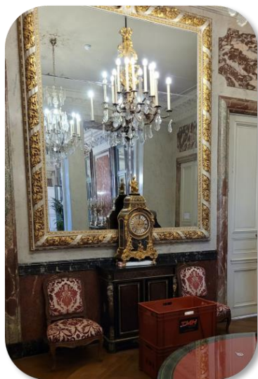
Mise en place d'un cartel de style régence au Ministère de la Justice.