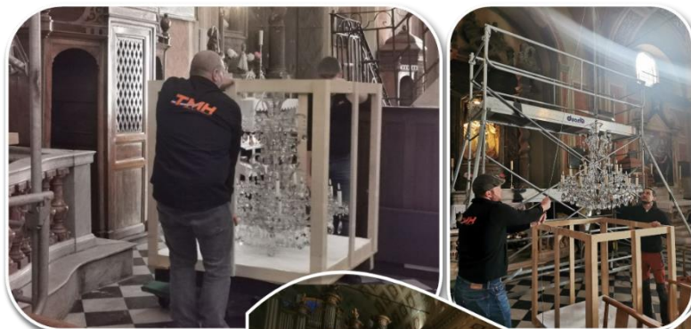
Dépose, transport et remontage pour la restauration des lustres de la Cathédrale Notre-Dame-de-l'Assomption d'Ajaccio